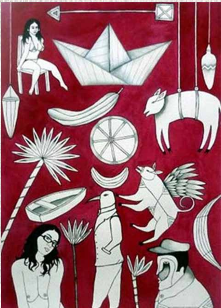
BETTY CON BARQUITO: Soid Pastrana