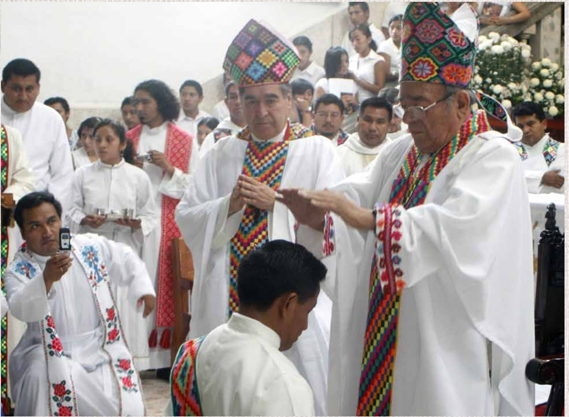
Obispo Samuel Ruiz García: FOTO ESPECIAL

AÑO INTERNACIONAL DE LAS POBLACIONES AFRODESCENDIENTES Y LOS BOSQUES